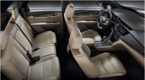
Surfaces des sièges en cuir Mulan beige Sahara avec des inserts perforés, tableau de bord avec finition noir de jais et garnitures en bois de sapelli naturel brillant