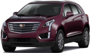
Violet d'améthyste profond métallisé