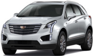
Gris radiant métallisé