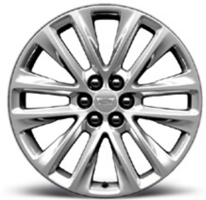
Jantes 20" à 12 branches en aluminium poli