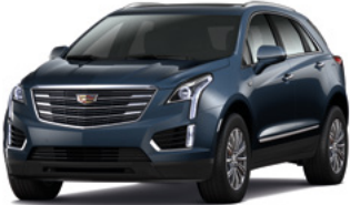
Bleu port métallisé