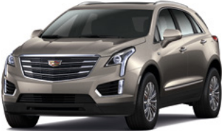
Bronze dune métallisé