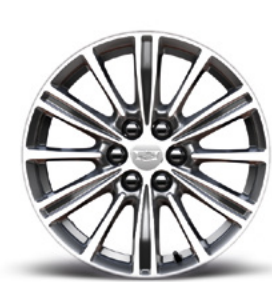
Jantes 18" en aluminium usiné brillant avec finition argent clair