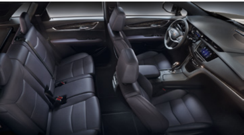
Sièges en cuir Mulan prune sombre avec des inserts perforés, tableau de bord avec finition noir de jais et garnitures en frêne olivier nouveaux