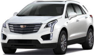
Blanc cristal en couche triple