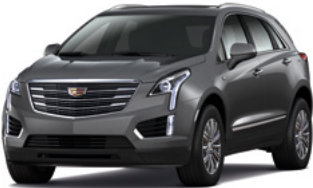
Granite foncé métallisé