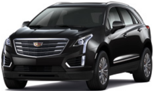
Noir stellaire métallisé