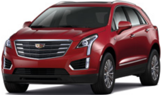
Teinte rouge passion