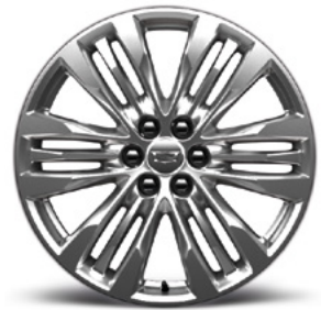
Jantes 20" en aluminium à face usinée ultra-brillante avec finition « Argent de minuit »