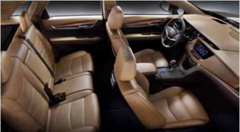
Sièges en cuir semi-aniline Opus couleur sucre d'érable avec des inserts perforés de chevron, tableau de bord avec finition noir de jais, ciel de toit en microfibre de suède et garnitures en bois de rose satiné