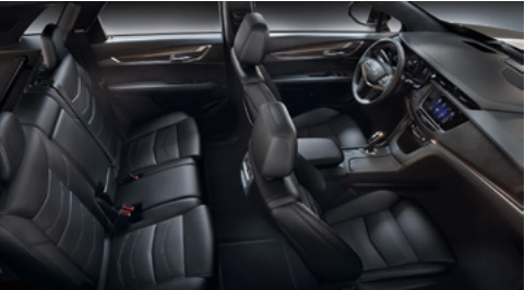
Sièges en cuir semi-aniline Opus noir de jais avec des inserts perforés de chevron, tableau de bord avec finition noir de jais, ciel de toit en microfibre de suède et garnitures en fibres de carbone couleur bronze