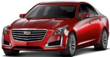
Teinte rouge obsession