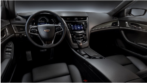
Sièges en cuir noir de jais, tableau de bord avec finition noir de jais et garnitures en fibres de carbone noire