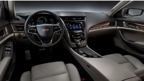
Sièges en similicuir platine clair, tableau de bord avec finition noir de jais et garnitures en bois de sapelli brillant