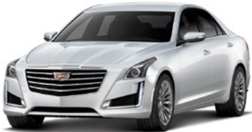
Blanc cristal en couche triple