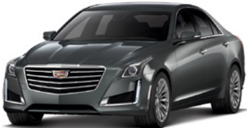
Gris spectral métallisé