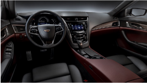
Sièges en cuir semi-aniline noir de jais, tableau de bord avec finition rouge Morello et garnitures en fibres de carbone rouge Morello