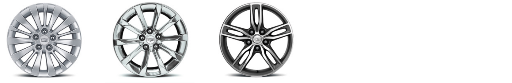
Jantes 18" x 8,5" à 15 branches en aluminium avec peinture « Argent sterling » Jantes 18" x 8,5" à 10 branches en aluminium poli Jantes 18" x 8,5" en alliage à face usinée ultra-brillante avec inserts en couleur « Minuit »