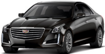
Noir stellaire métallisé