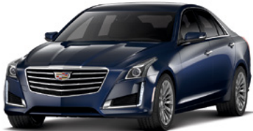
Bleu foncé adriatique métallisé