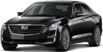
Noir stellaire métallisé