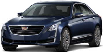
Bleu foncé adriatique métallisé