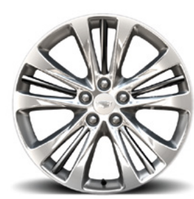
Jantes 20" x 8,5" à branches multiples en aluminium à face usinée ultra-brillante avec inserts en argent Manoogian