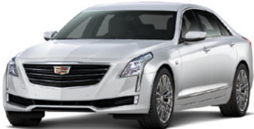
Blanc cristal en couche triple