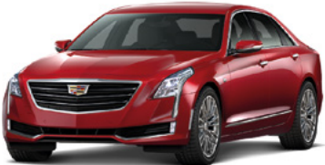
Teinte rouge horizon