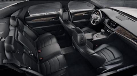
Surfaces des sièges en cuir noir de jais avec des inserts perforés de chevron, tableau de bord avec finition noir de jais et garnitures en peuplier nouveaux minéral brillant/en fibres de carbone couleur bronze au fini brillant