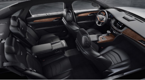
Sièges tout cuir semi-aniline noir de jais avec des inserts perforés de chevron, tableau de bord avec finition noir de jais et garnitures en bois de sapelli naturel chocolat noir brillant/en fibres de carbone couleur bronze au fini brillant