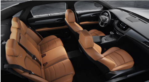
Surfaces des sièges en cuir cannelle avec des inserts perforés de chevron, tableau de bord avec finition noir de jais et garnitures en fibres de carbone sergées/noir piano au fini brillant