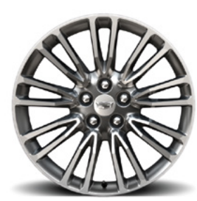
Jantes 20" x 8,5" à 5 doubles branches en aluminium poli avec peinture haut de gamme argent Manoogian et 5 inserts chromés