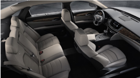
Surfaces de sièges en cuir platine clair avec des inserts perforés de chevron, tableau de bord avec finition noir de jais et garnitures en peuplier nouveaux minéral brillant/fibres de carbone couleur bronze au fini brillant