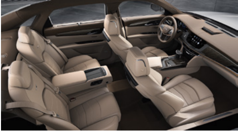
Sièges tout cuir semi-aniline en cachemire clair avec finition couleur sucre d'érable et des inserts perforés de chevron, garnitures en bois d'eucalyptus café noir brillant/en bois d'eucalyptus café au lait brillant