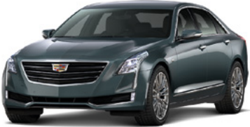
Gris pierre métallisé