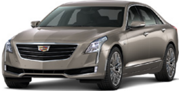
Bronze dune métallisé